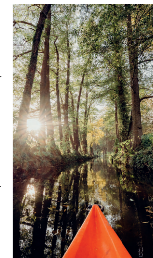
Kanoutour durch den Spreewald

Überall empfangen Kahnfährleute die Gäste, um mit ihnen sommers wie winters durch urwüchsige Erlenwälder und zu romantischen Ausflugszielen zu staken. Der Gurkenradweg lädt zu Radtouren vorbei an Gurkenfeldern und historischen Blockbohlenhäusern ein. Außerdem ist der Spreewald die Kulisse einer geheimnisvollen Sagenwelt, der packenden Spreewaldkrimis und sorbischer/wendischer Traditionen.