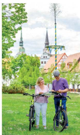
Radtour in Elbe-Elster-Land

Die frischen Produkte von Erzeugern aus der Region oder die bodenständigen Gerichte in den Gasthöfen lassen den abwechslungsreichen Tag gesund und genussvoll ausklingen.