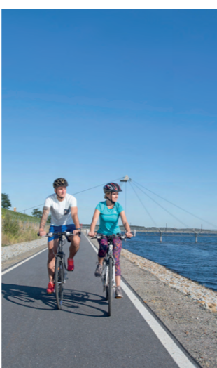
Radfahren am Wasser

Darüber hinaus gibt es Gelegenheiten zum Baden, Segeln, Surfen und Wakeboarden. Gleichzeitig ist die junge Urlaubsregion auch eine riesige Landschaftsbaustelle mit imposanten Monumenten der Industriekultur. Stimme, technische Zeugen des Bergbaus haben hier als Landmarken, Museen oder Veranstaltungsorte ein zweites Leben erhalten.