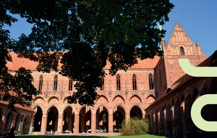
Historische Gemäuer von Kloster Chorin