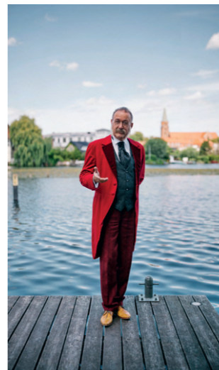
Brandenburg an der Havel