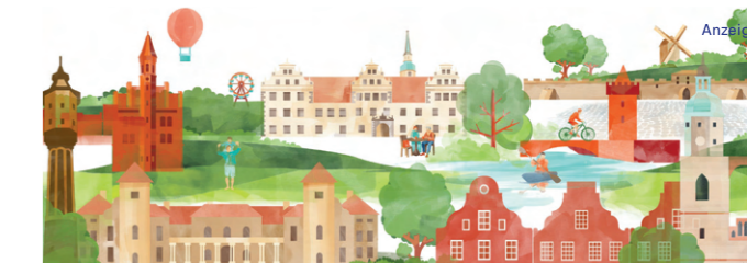
Illustration: Juliane Lenz

Tourismusverband Ruppiner Seenland e. V. ruppiner-seenland.de info@ruppiner-seenland.de T. +49 3391/65 96 30