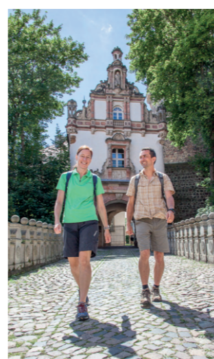
Burgenwanderweg in Wiesenburg

Regionale Produkte lassen sich nach einem erholsamen und ereignisreichen Tag bei einem der Gastgeber vor Ort genießen oder mit nach Hause nehmen.