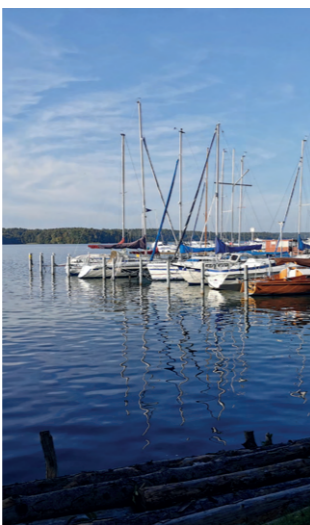
Blick über den Werbellinsee

Das ehemalige Zisterzienserkloster Chorin im Stil der frühen Backsteingotik, die Schiffshebewerke Niederfinow, der Hollandpark und der Zoo Eberswalde sind beliebte Ausflugsziele.