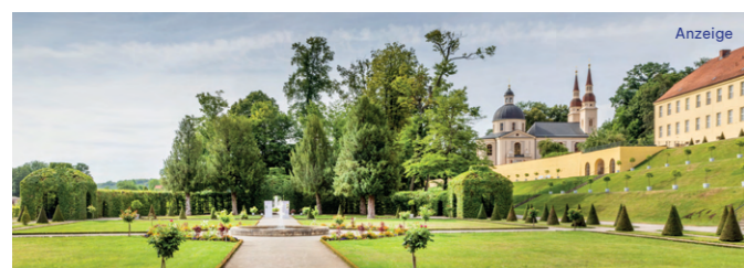
Ein Blick in den barocken Klostergarten des Klosters Neuzelle

WITO Wirtschafts- und Tourismusentwicklungsgesellschaft mbH des Landkreises Barnim barnimerland.de info@barnimerland.de T. +49 33 34/591 00