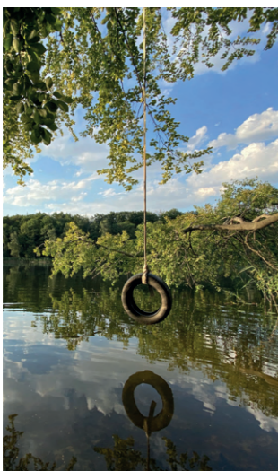
Auszeit am See in der Uckermark

Neues ausprobieren und die Uckermark für sich entdecken!