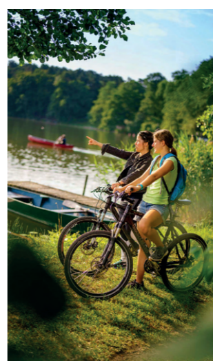
Fahrradtour mit Seeblick, Himmelport